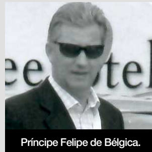
Príncipe Felipe de Bélgica.