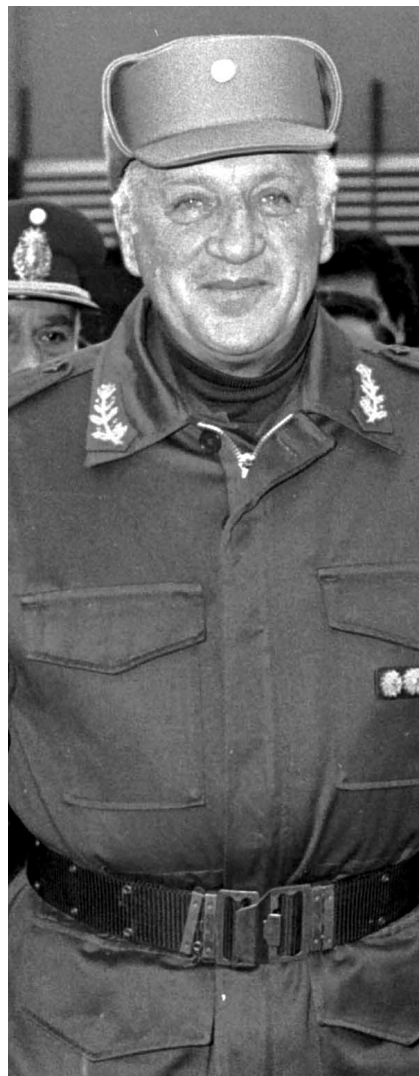
Leopoldo Fortunato Galtieri, responsable de la Guerra de las Malvinas. El tema se habría discutido en una reunión del Bilderberg.