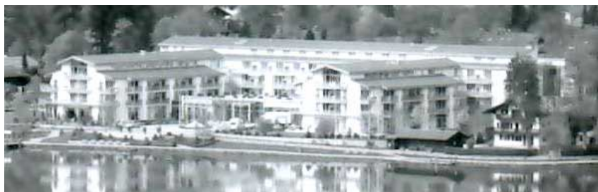
Hotel Dorint Sofitel Seehotel Überfahrt, en Rottach Egern, donde se reunió Bilderberg en 2005.

Desconocido hasta no hace mucho, ahora trascienden detalles de su funcionamiento; unos dirán que Bilderberg no existe; otros que es una exageración; otros que es culpable de todos los males; en cualquier caso, hay que informarse sobre qué es una de las organizaciones más poderosas del mundo.