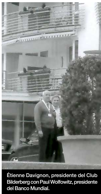
Étienne Davignon, presidente del Club Bilderberg con Paul Wolfowitz, presidente del Banco Mundial.