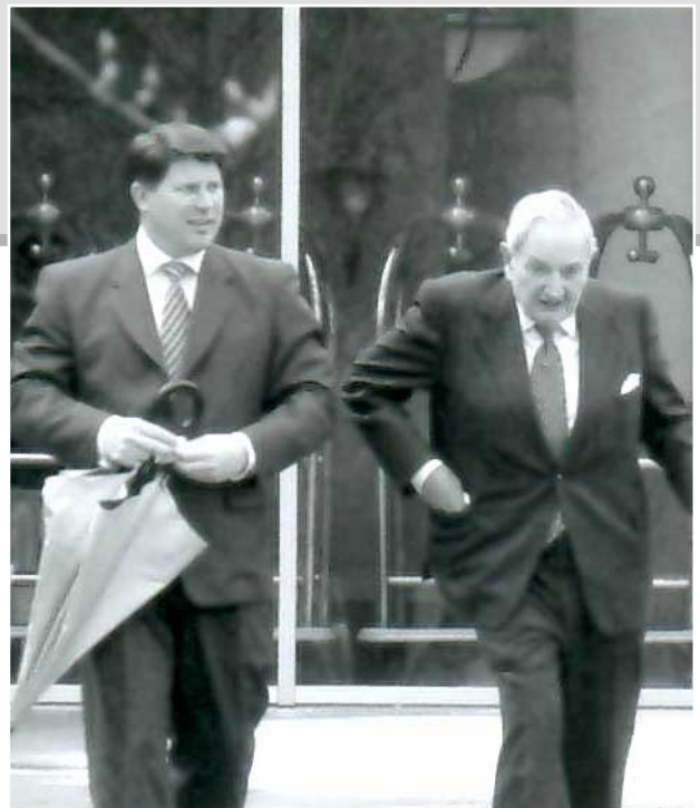
David Rockefeller con su guardaespaldas. Es el auténtico dinosaurio del Bilderberg, uno de sus fundadores.

La presidencia de la mesa de trabajo sigue un orden alfabético rotatorio. Hay un máximo de delegados: 130, y según la